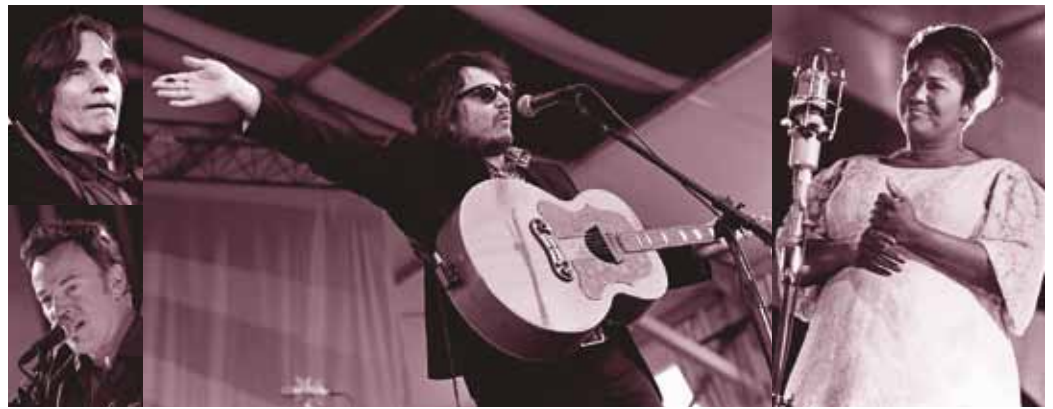
Jackson Browne, Bruce Springsteen, Wilco, Jeff Tweedy och Mahalia Jackson har kommit med vitt skilda Jesus-budskap i sin musik.